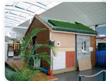
Éco maison connectée nord